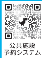
公共施設予約システム

市内公共施設の使用には、インターネット上で予約ができる便利な「公共施設予約システム」をご活用ください。 右のQRコードや市ホームページのバナーからアクセスできます。 ※ご利用には、利用者登録が必要です。 ※従来の紙媒体による申請もできますが、予約システムを利用した申請と重複した場合は、システムを利用した申請が優先となります。 ※一般公開実施施設での一般公開日は、従来どおり予約なしで利用できます(予約システムの利用者登録不要)。