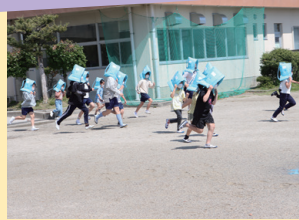
▲全校児童が全力で避難

協議会から箕田小学校の児童へ、防災頭巾を寄贈し、それを使った合同防災訓練を実施しています。子どものころから防災への意識を高めることで、災害に強いまちづくりにつなげています。