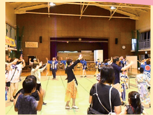
▲最後はみんなで「箕田音頭」

よさこいやチアダンスなどのショーや、キッチンカーや夜店などで盛り上がる「みだフェス」。子どもからお年寄りまで楽しむことができ、地域の皆さんが交流する機会を創出しています。