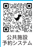
公共施設 予約システム

市内公共施設の使用には、インターネット上で予約ができる「公共施設予約システム」をご活用ください。 右のQRコードや市ホームページのバナーからアクセスできます。