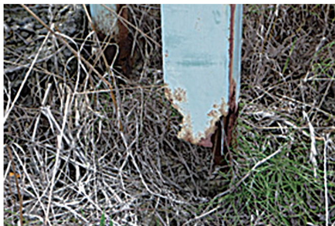
▲支柱基礎部の腐食

広告物の設置者や管理者は、定期的な点検 や修繕などを行い、適切に管理しましょう。