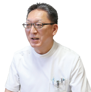
村瀬病院 糖尿病専門医

糖尿病は、早期発見と治療の継続が重要です。健康診査などで、自分の体の状態を確認することから始めましょう。