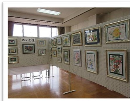
第31回 鼓ヶ浦公民館文化祭

2月10日(土)11日(日)18日(日)に行われた文化祭には約500名の方にご来館いただきました！ ありがとうございます。