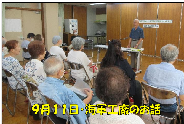
9月11日・海軍工廠のお話