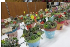
10月9日 ミニ鉢に多肉寄せ植え講座