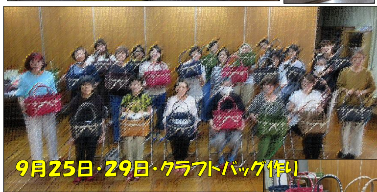
9月25日・29日・クラフトバッグ作り