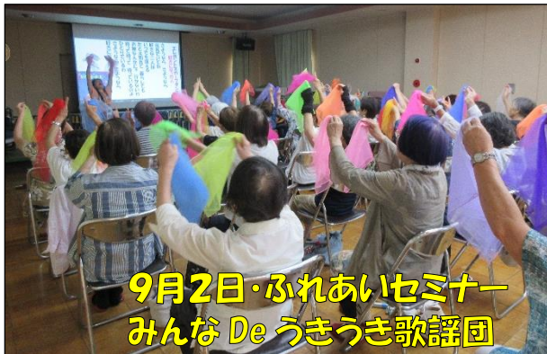
9月2日・ふれあいセミナー みんな De うきうき歌謡団