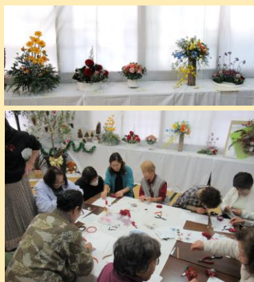
フラワーデザインサークル