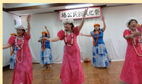
フラダンス ～アロハオーリーブ～