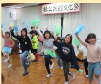
放課後児童クラブ「ひまわり」