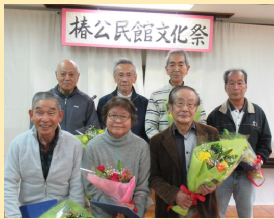
おでかけハッピー号 感謝状受賞者