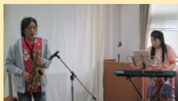
みんなDeうきうき 歌謡団