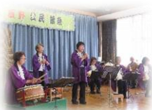
【民謡・三味線・唄】