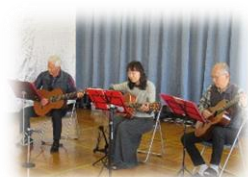
【みんなで歌って踊ろう】