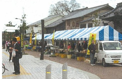
地元物産品の販売やフリーマーケット