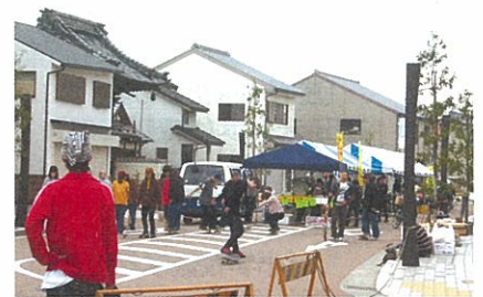
スケボー大会に参加する若者たち