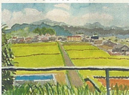
【学校の裏から見た私の校区】 山鹿 貴絵 (合川小5年)