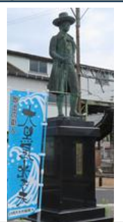
大黒屋光太夫銅像