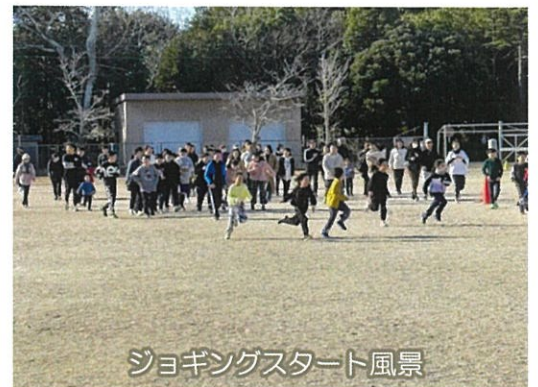
ジョギングスタート風景

参加いただいた町民の皆さん、準備・運営にご協力いただいたボランティアスタッフ、役員の皆さん、ありがとうございました。