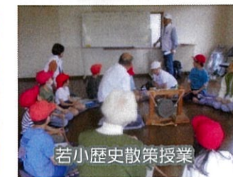
若小歴史散策授業