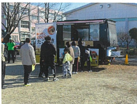
キッチンカーの絶品たこ焼き