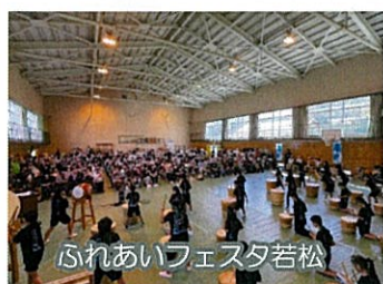
ふれあいフェスタ若松