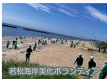
若松海岸美化ボランティア