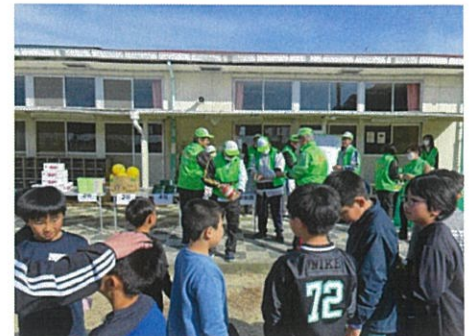
わくわくドキドキの抽選会