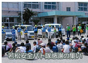
若松安全パト隊感謝の集い