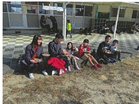
完走後のたこ焼きタイム