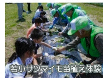
若小サツマイモ苗植え体験