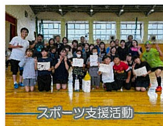
スポーツ支援活動