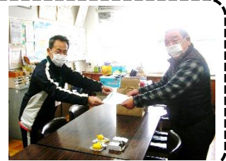
庄野東まちづくり委員