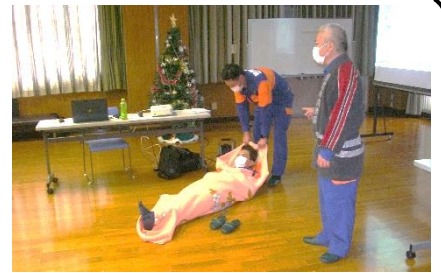
消防団庄野分団による搬送方法実演の様子

12月12日庄野地区各自治会より5名ずつの出席をお願いし、それぞれの該当地区ごとに集まりました。防災コーディネーター2名と市防災危機管理課4名にも来ていただき、パソコンで庄野地区の地図に水害と地震の危険箇所を落とし込み、避難経路の説明に活かしました。出席者は防災マップの作成に各自地域の実情と特色や過去の被害教訓を生かして作成したので、水害、地震が起こった場合は、いち早く避難経路を見つけて避難したいと話していました。