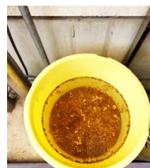
4/9 ぬるい水に浸ける