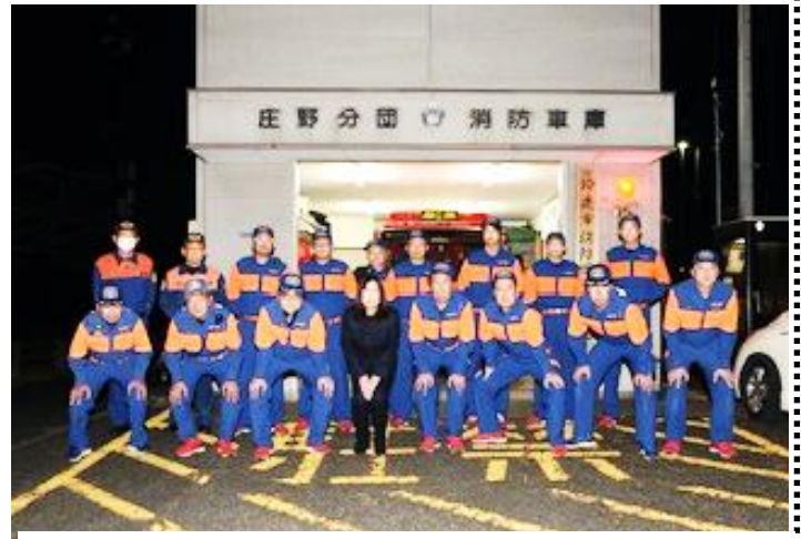
歳末特別警戒 市長消防署長巡視

消防分団は、地区の火災や災害 市主催の防災訓練や消防学校での講習訓練 毎月の資機材点検各地区防災訓練 防火週間ボランティア活動各種会議参加など年間活動は少ない年で 延べ110回以上8500時間を超える活動を現在15名 皆で力を合わせて活動させて頂いております。そんな消防団活動に何時もご理解ご協力を賜っております皆様そして各分団員のご家族の皆様にご心より感謝し お礼とともに今後とも庄野消防分団への力添えをよろしくお願い致します。