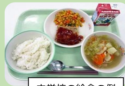
中学校の給食の例