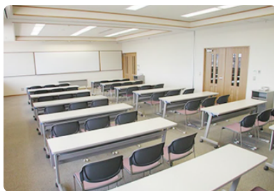
研修室 1 A・1 B