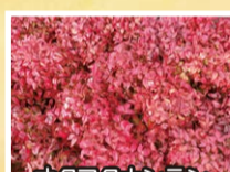
オタフクナンテン

植木の一大産地といえる鈴鹿市。これからも消費者から選ばれ続けるために、工夫を重ねながら、生産が続けられます。