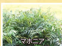
マホニア コンフューサ