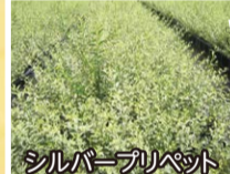
シルバーアリペット