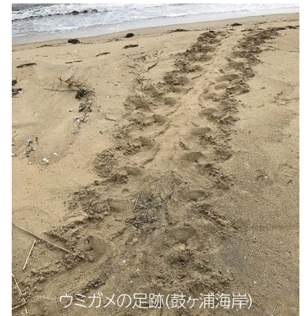
ウミガメの足跡(鼓ヶ浦海岸)

※詳しくは、市ホームページ(☎ https://www.city.suzuka.lg.jp/gyosei/plan/kankyuu/umigame/index.html )をご覧ください。