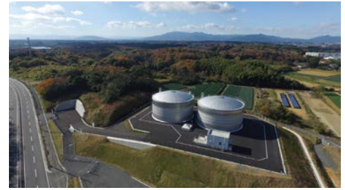
▲国府第2配水池 外観