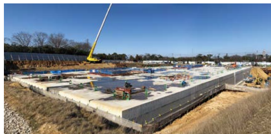
▲住吉配水池 工事風景

配水池の本体部分の工事が完成し、今年度から来年度の供用開始に向けて、現在、電気工事などの関連工事を進めています。