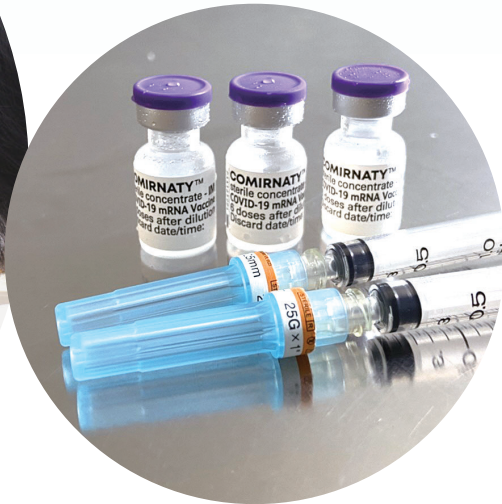
◀ 医療従事者に対するワクチン接種の様子