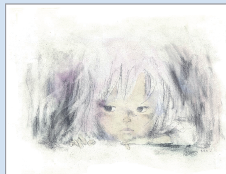
いわさきちひろ 戦火のなかの少女 「戦火のなかの子どもたち」(岩崎書店より 1972年)