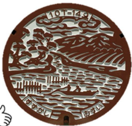
▲ 鈴鹿市公共下水道 マンホールデザイン

「下水道の日」は、下水道の大きな役割である「雨水の排除」を念頭に、台風シーズンである「二百十日」を過ぎた、立春から数えて220日目の9月10日に定められました。