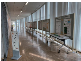
▲市役所本館市民ギャラリー