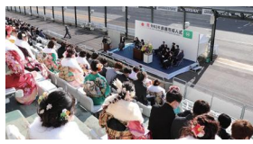
▲令和3年成人式の様子

成人式は大人の仲間入りを祝福、激励する一生に一度の記念すべき式典です。成人式実行委員会ではさまざまなイベントを計画しています。新成人の皆さんは、ぜひご参加ください。