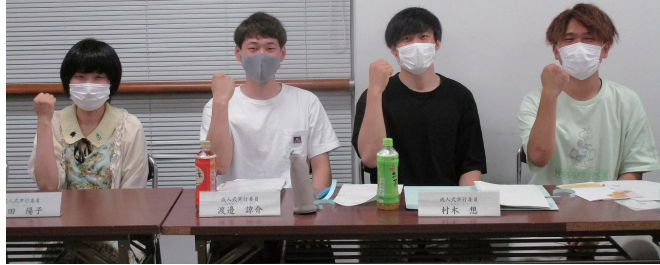
▲鈴鹿市成人式実行委員メンバー