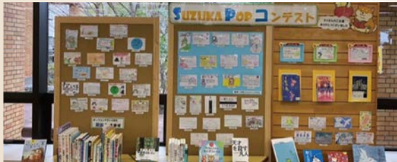
▲令和3年度 展示の様子

力作ぞろいのポップをご覧ください、新たなお気に入りの本との出会いをお楽しみください(展示期間: 1月5日(水)~31日(月))。