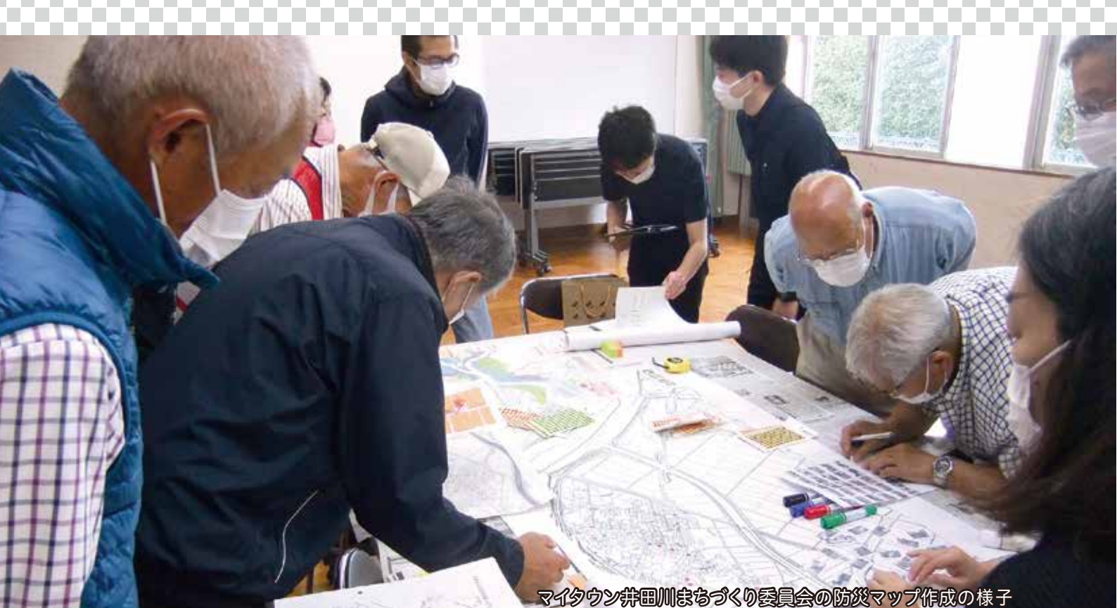
マイタウン井田川まちづくり委員会の防災マップ作成の様子