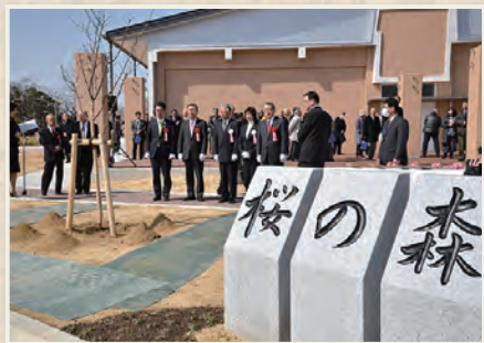
▲防災機能を併せ持つ桜の森公園