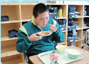
現在の給食の様子

将来プロ野球 選手になるために、 おいしい給食を 食べて、体を作っ ていきたいです。