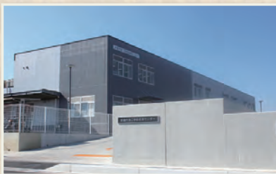
▲中学校給食開始に伴い整備された第二給食センター