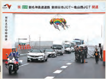
開通を迎えた「新名神高速道路」