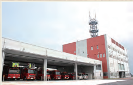
▲建て替えられた消防新庁舎