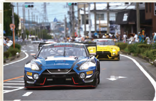
▲片道3.3kmの封鎖された公道をパレードするGT3のマシン