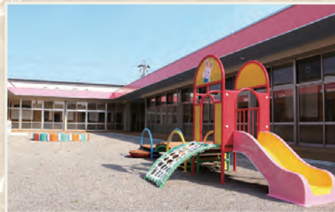
▲市内の公立保育所の拠点施設として、病後児保育や一時預かり保育を行う西条保育所