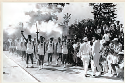
▲市内ですべてつなげられた聖火