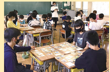
▲授業の一環でつながるたに取り組む井田川小学校の皆さん