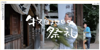
▲ホームページトップページ

伝統的な祭礼や文化遺産がある牧田地区。ホームページ「牧田地区の祭礼」を公開し、伝統を後世に伝えています。