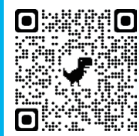
公共施設予約システム

市内公共施設の使用には、インターネット上で使用予約ができる「公共施設予約システム」をご活用ください。予約システムの利用には、利用者登録が必要になりますので、右の二次元コードからご登録の上、ご利用ください。