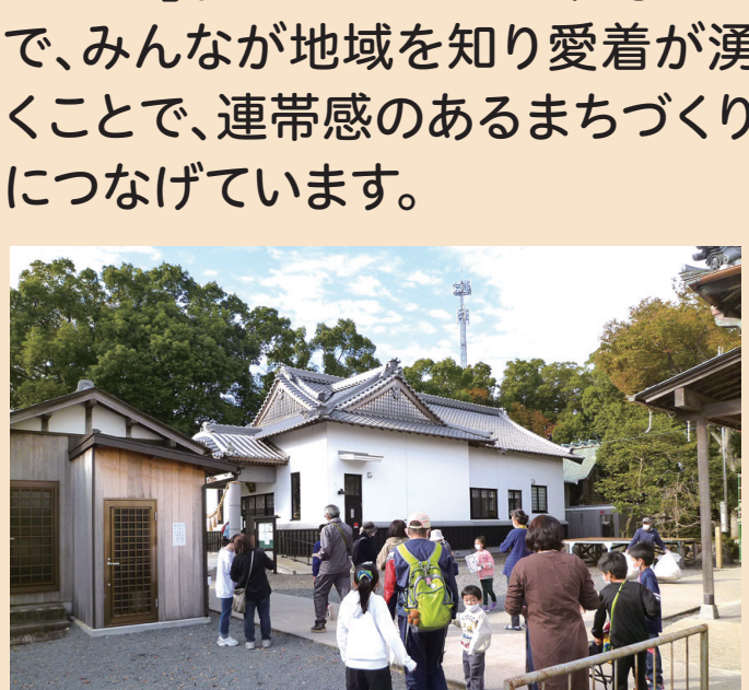
▲きれいな海岸をいつまでも

毎年、春と秋の2回、千代崎海岸を中心に「若松海岸通り美化ボランティア」を実施。きれいな海岸や海水浴場を維持することで、みんなが訪れたいくなるまちを目指しています。