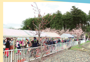
▲多くの人でにぎわう桜まつり