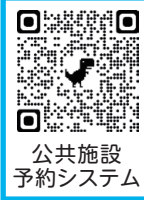
公共施設予約システム