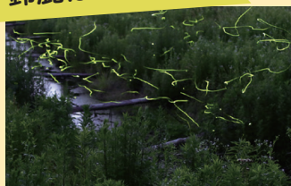
▲夏の始まりを告げるホタル

活気ある地域づくりにつなげるため、“かみのほたるを守る会”と協同で「鈴鹿ほたるの里」の鑑賞路などを整備しています。ホテルの活動が最も盛んな6月上旬ごろには、市内外からたくさんの人が訪れる人気スポットです。