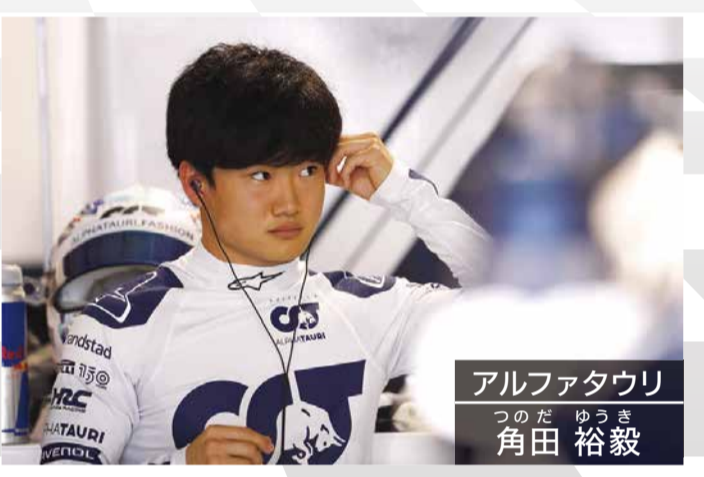
アルファタウリ つのだ ゆうき 角田 裕毅

7年ぶりに誕生した日本人ドライバーがアルファタウリに所属する角田裕毅選手です。第12戦フランスグランプリでは、予選で8位を獲得するなど、その速さは秀逸。走り慣れた鈴鹿で、最高の走りが期待されます。