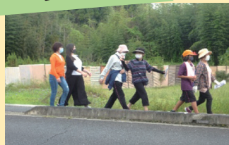
▲みんなで楽しくウォーキング

健康づくりと郡山の魅力を再発見できる「歩こう会」を実施。子どもからお年寄りまでたくさんの方が参加することで、地域のつながりを強化しています。活動内容は郡山まちづくり協議会ホームページで紹介しています。