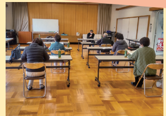
▲支援内容を熱心に聞く皆さん