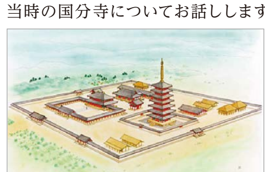
伊勢国分寺復元図 早川和子作