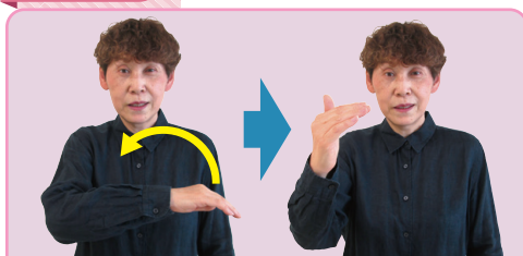
【山】左から右へ山の形を描く