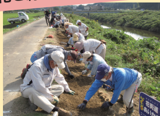
▲花と緑があふれた合川に

中ノ川堤防や合川地区内の畑などに花の球根や種を植え、春はスイセン、秋は彼岸花などが楽しめる景観づくりを行っています。きれいな花と緑を増やすことで、住民みんなに愛され、魅力あるまちづくりにつなげています。