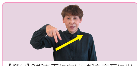
【登り】2指を下に向け、指を交互に出して斜め上へ進める(歩いて登る様子)