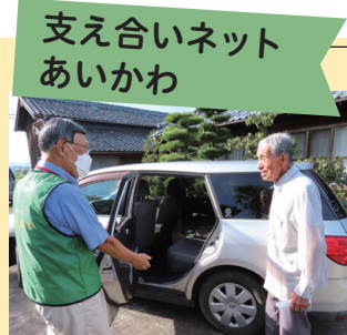
支え合いネット あいかわ ▲お互い様の気持ちで 助け合い