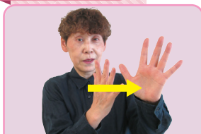
両手を立てて前へ出す(並んでハイキングへ向かう様子)