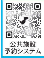
公共施設予約システム

※一般公開実施施設での一般公開日は、従来どおり予約なしで利用できます(予約システムの利用者登録不要)。