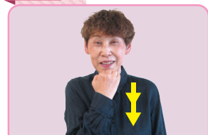
右手拳で顎をこするように2回下ろす(栗の渋皮を歯でむく様子)