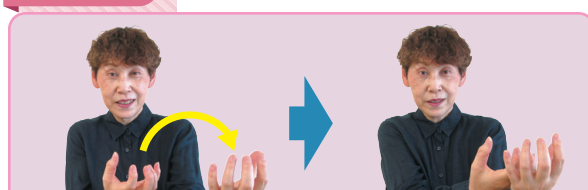
放ったボールを目標のボールに当てる様子を表現

※白いボール(目標球)に向かって赤と青それぞれ6個のボールを投げる、転がすなどして、どれだけ白いボールに近づけられるかを競う競技です。