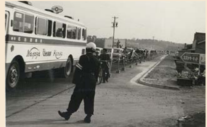
▲サーキットへ向かう長い車列 (サーキット道路)