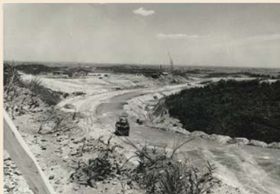
▲建設中の最終コーナー

市制施行80周年を迎える本年、日本初の国際レーシングコースである「鈴鹿サーキット」も開場60周年を迎えています。