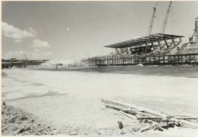
▲建設中のメインストリート

私たちの住むまちSUZUKAが「モータースポーツのまち」として世界に知られているのは、鈴鹿サーキットを抜きに語ることはできないでしょう。