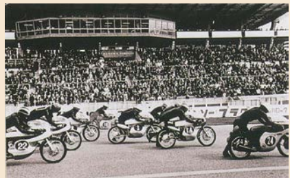
▲世界選手権 第2回日本グランプリ ロードレース