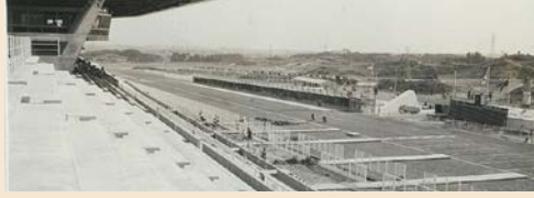
▲完成した鈴鹿サーキット