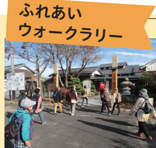
▲熱心に庄野の活性化を考える

地域の神社、古墳、防災施設などを歩いて巡る「ふれあいウォークラリー」。関や土山など他の宿場町でもウォークラリーを実施し、史跡などを見て回ることで、庄野のまちづくりにも生かせるヒントを見つけ、地域の活性化につなげています。