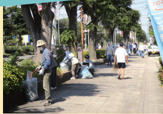
▲庄野地区をきれいなまちに

鈴鹿川堤防や道路など庄野地区全体を住民みんなで清掃する「庄野クリーン大作戦」。地域の中学校や鈴鹿高校の生徒と協力しながら、住み心地の良いきれいなまちづくりに取り組んでいます。