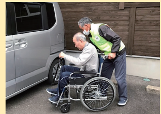
▲車いすに乗った方も送迎