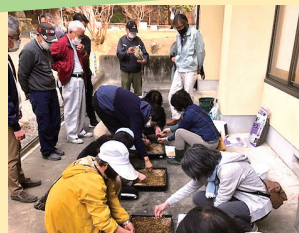
▲ムラサキツツジの苗木づくり

春、伊奈富神社周辺に咲き誇るムラサキツツジ。稲生小学校の校歌の一節「紫つつじ咲く丘」を再現するため、小学生や高校生などと共に、親木から採った種から育てた苗木を学校などへ植樹し、花であふれる稲生を目指しています。