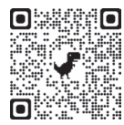
公共施設予約システム

市内公共施設のするには、インターネット上で予約ができる「公共施設予約システム」をご活用ください。 右の二次元コードや市ホームページのバナーからアクセスできます。