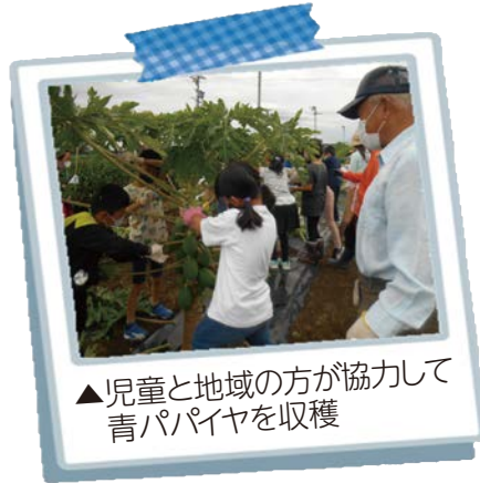
▲児童と地域の方が協力して青パパイヤを収穫

今年度は青パパイヤの植え込みと収穫を実施。地域の皆さんがつながるきっかけとなりました。