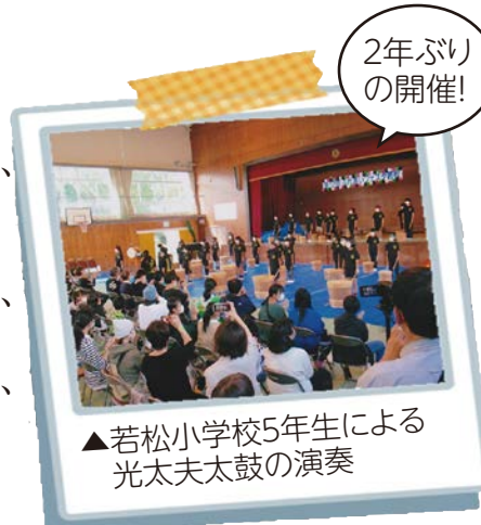
▲若松小学校5年生による光太夫太鼓の演奏

住民同士のふれあいの場や活動発表の場とするとともに、若松の伝統文化を伝承するため開催された「ふれあいフェスタ若松」。千代崎中学校の生徒、若松小学校の児童、地域の皆さんが演奏や演技をしたほか、若松の伝統文化である光太夫太鼓や獅子舞を披露。大いに盛り上がりを見せました。