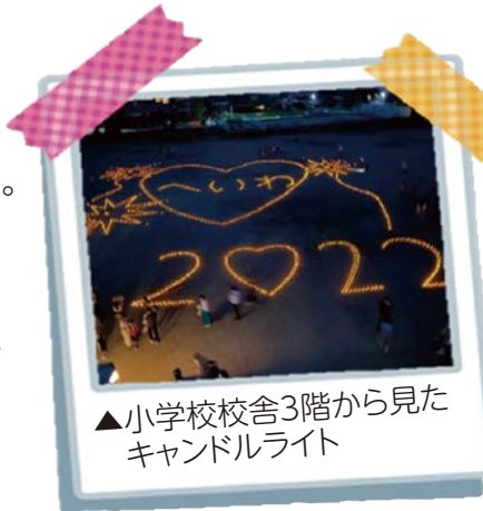
▲小学校校舎3階から見たキャンドルライト

地域の方に楽しんでもらいながら、交流を深めてもらうため開催された「あたごの灯り」。愛宕小学校児童のデザインをもとに、5・6年生の有志で構成される「あたごっちボランティア」によってキャンドルライトが並べられました。たくさんの方が来場し、大盛況となりました。