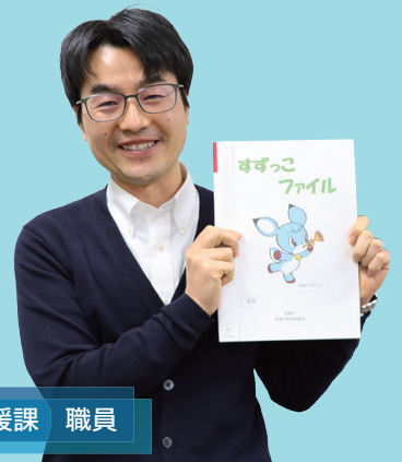
子ども家庭支援課 職員

妊娠届出時に配布しています。生まれてからの成長記録をまとめることができますので、ご活用ください。