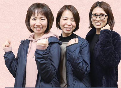
神戸小学校 介助員の皆さん