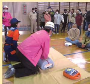
▲救急処置方法を学ぶ参加者

住民が各地域の避難所に避難する「サテライト型防災訓練」。河曲小学校に設けられた訓練本部では、避難者数の集約、地震体験車や自主防災隊による放水など、実災害を想定した訓練を行うことで、防災力の高い地域づくりにつなげています。