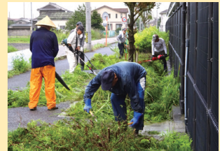
▲熱心に草刈りをする皆さん