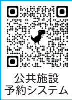
公共施設予約システム

市内公共施設の使用には、インターネット上で予約ができる「公共施設予約システム」をご活用ください。 右の二次元コードや市ホームページのバナーからアクセスできます。 ※ご利用には、利用者登録が必要です。 ※従来の紙媒体による申請もできますが、予約システムを利用した申請と重複した場合は、システムを利用した申請が優先となります。 ※一般公開実施施設での一般公開日は、従来どおり予約なしで利用できます(予約システムの利用者登録不要)。