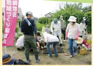
▲野菜の種を植える皆さん