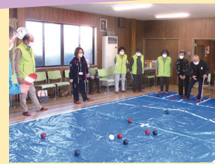
▲ポッチャを楽しむ皆さん

鈴峰地区内の地域によっては、老人クラブや婦人会がなくなる中、協議会として「サロン」を実施しています。「つながりづくりは地域づくり」をコンセプトに、体を動かしたり、音楽を聴いたり、高齢者の方が「楽しい」と思える活動を実施することで、元気なまちづくりにつなげています。