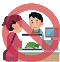
販売・購入・頒布 ※ ※広く配布すること

(出典)環境省ホームページ https://www.env.go.jp/nature/intro/2outline/regulation/jokentsuki.html