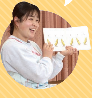
令和3年入庁 保育所職員

保育士は、保育所で子どもの保育を行います。子どもの日々の成長に、ときに笑い、ときに感動できるやりがいのある仕事です。