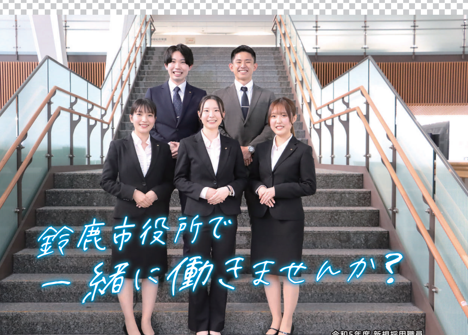
令和5年度 新規採用職員

市 役所の仕事という、法律や条例で定められた業務を、マニュアル通りにこなし、自分の思いや、考えを反映させるのが難しい仕事と思われることが多いですが、実際には違います。