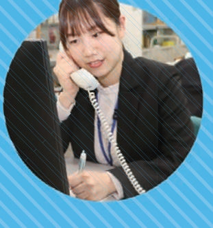
令和4年入庁 地域協働課職員

事務職は、税や福祉など、市民の方々と直接関わる仕事のほか、市のPRに関わる仕事、予算編成など、業務は多岐にわたります。