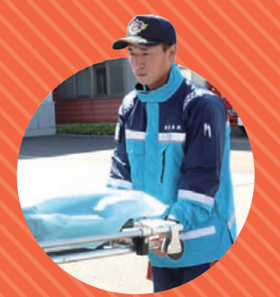
令和4年入庁 中央消防署職員

消防士は、火災や救急、救助などさまざまな災害現場にいち早く駆け付け、市民の安全・安心を守る仕事です。