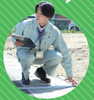
令和4年入庁 道路整備課職員

技術職は、市の道路や建物、施設を新しく作ったり、直したり、維持管理したりする仕事です。