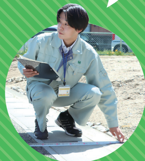
令和4年入庁 道路整備課職員

技術職は、市の道路や建物、施設を新しく作ったり、直したり、維持管理したりする仕事です。