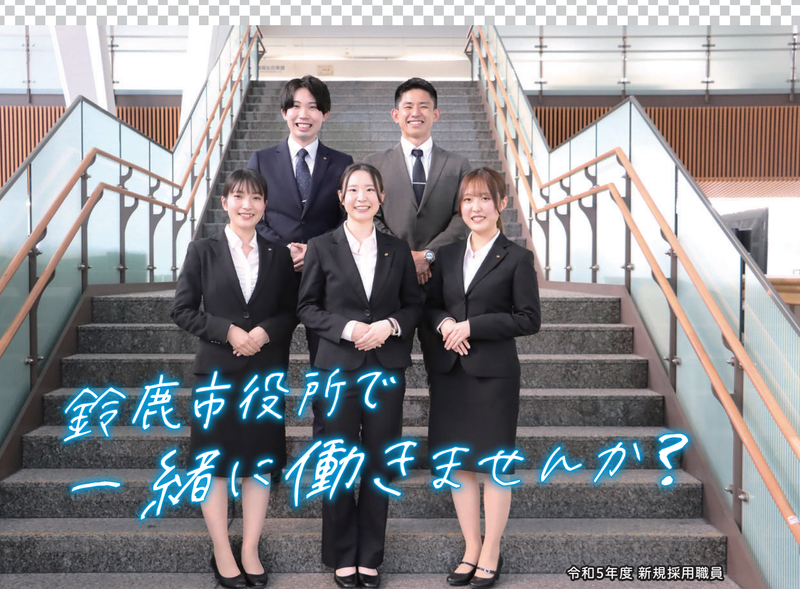
令和5年度 新規採用職員

市 役所の仕事というと、法律や条例で定められた業務を、マニュアル通りにこなし、自分の思いや、考えを反映させるのが難しい仕事と思われることが多いですが、実際には違います。