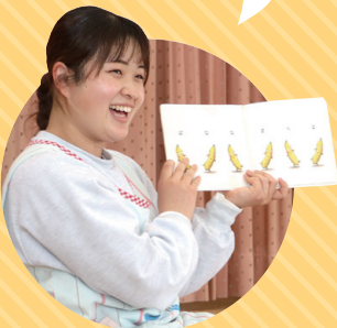
令和3年入庁 保育所職員

保育士は、保育所で子どもの保育を行います。子どもの日々の成長に、ときに笑い、ときに感動できるやりがいのある仕事です。