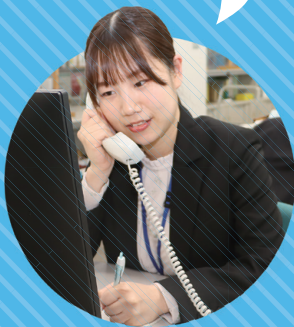
令和4年入庁 地域協働課職員

事務職は、税や福祉など、市民の方々と直接関わる仕事のほか、市のPRに関わる仕事、予算編成など、業務は多岐にわたります。