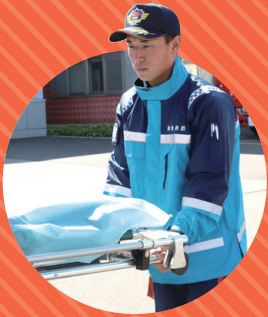
令和4年入庁 中央消防署職員

消防士は、火災や救急、救助などさまざまな災害現場にいち早く駆け付け、市民の安全・安心を守る仕事です。