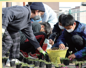
▲協力して芝桜を植える参加者

旭が丘小学校卒業生と協議会とで、毎年、卒業記念の共同事業を行っています。昨年度は、芝桜の植え付けと児童デザインによる陶器製のプレートを設置しました。この事業により、子どもたちの郷土愛を育てています。