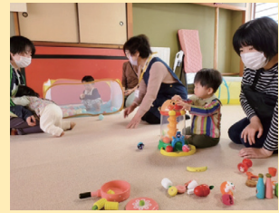
▲伸び伸びと遊ぶ子どもたち

子育て家庭を支援するため、乳幼児とその親を対象とした「ひまわりっこ」を開催し、保健師の講話やおもちゃづくりなどを行っています。近所付き合いが少なくなる中、地域の親子同士が交流することで、コミュニティの強化につなげています。