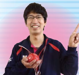
スポーツ推進委員

ボールを投げてジャックボール(目標球)を動かすことなどで、大逆転が起きるボッチャ。最後まで、試合結果が分かりません。